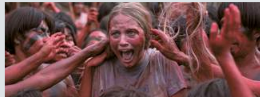
THE GREEN INFERNO

Van The Texas Chain Saw Massacre over The Silence to the Lambs tot Cannibal! The Musical : aan kannibalen geen gebrek in het Grote Filmgeschiedenisboek. 35 jaar na Ruggero Deodato's genreklassieker Cannibal Holocaust waagt hedendaags horror-auteur Eli Roth zich aan een succulente soortgenoot. Zijn premisse: een groepje wereldverbeteraars belandt in de klauwen van een hongerige Amazonestam.