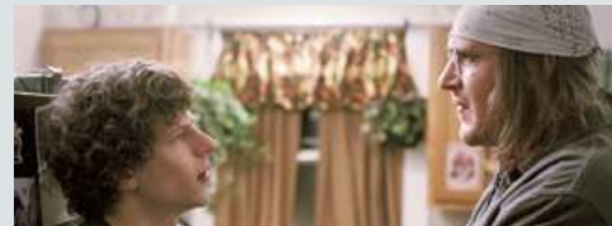
THE END OF THE TOUR

De film gaat over legendarisch auteur David Foster Wallace en de hoofdrollen worden vertolkt door Jesse 'The Social Network' Eisenberg en Jason 'Forgetting Sarah Marshall' Segel. Maar als dat nog niet genoeg redenen zijn om te gaan kijken: regisseur James Ponsoldt heeft met Smashed en The Spectacular Now twee voortreffelijke indies op zijn naam staan en is ondertussen The Circle van Dave Eggers aan het verfilmen.