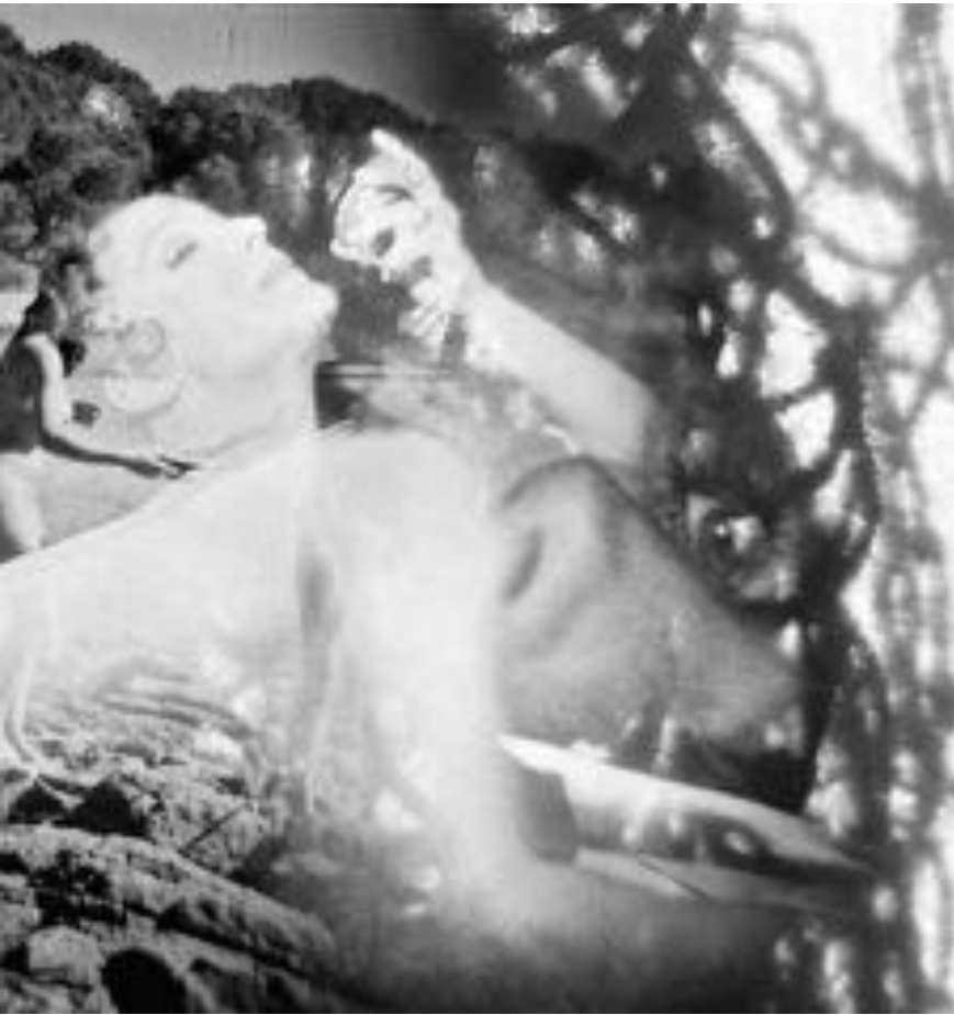
The Exquisite Corpus