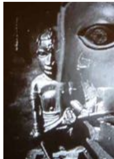
Les statues meurent aussi